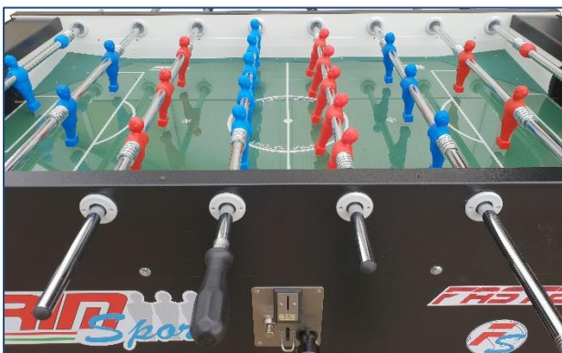
Bordature in ABS

Le boccole e la molle FS, consentono di avere una copertura perfetta sotto sponda